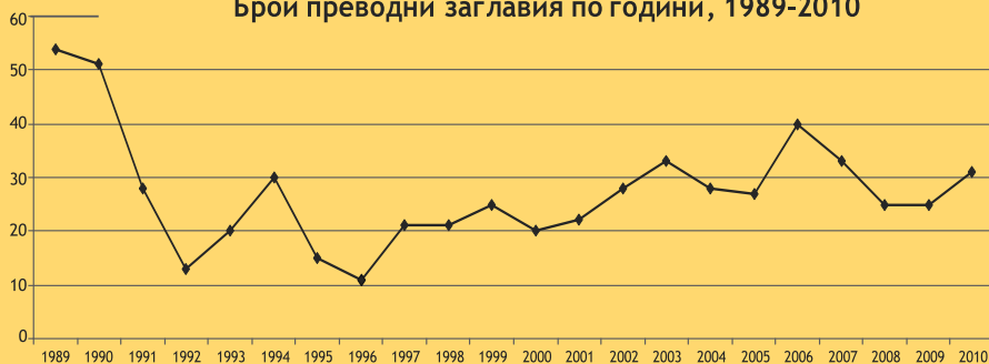
Фиг. 1: Брой преводни заглавия по години, 1989-2010

Спадът на преводите през 90-те години се дължи както на политико-институционални, така и на специфично литературни причини. От една страна се разпадат старите механизми и структури за литературен обмен и на тяхно място не се създават нови, които по адекватен на европейската представа за културен мениджмънт начин да управляват процеса, да формират културни политики. От друга страна изключителната динамика на литературната ситуация - ревизия на традицията, разоряване на езиците, поява на нови гласове, дискредитиране на стари и т.н. - я прави „нечетлива“ за външно око и - при липсата на добри канали за комуникация - поставя някои чуждес-