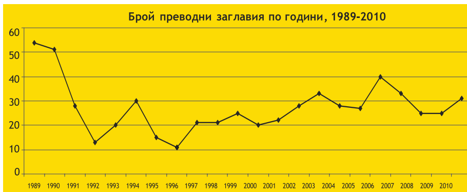
Фиг. 1: Брой преводни заглавия по години, 1989-2010

Ако изключим от статистиката този тип заглавия, през 90-те години излизат около 200 заглавия, докато след 2000-ната година има постепенно обратно движение - нарастване на броя на преводните издания до над 300.